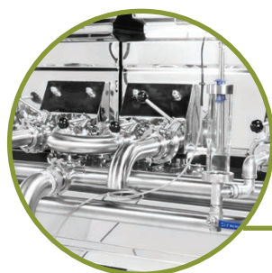
INVERSEUR DE COULÉE AVEC SORTIE CENTRALE