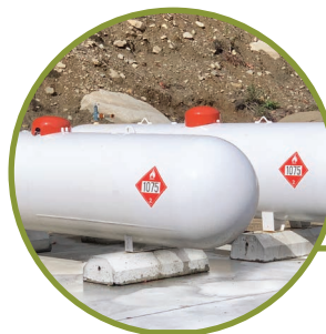
DISPONIBLE AU PROPANE